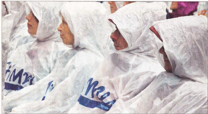
„Ein paar hundert Zwerg“: Zuschauer beim Konzert von „Jetsam 5“.